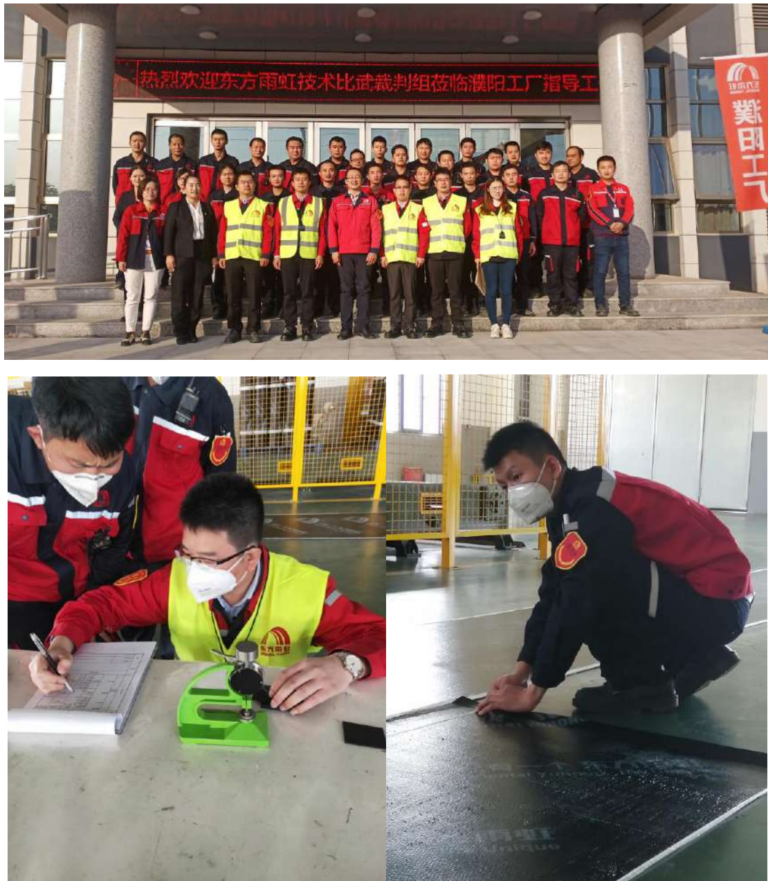
图 1 河南东方雨虹技术比武照片

来，一旦发现产品质量问题，可以迅速进行质量跟踪，查清质量责任，总结经验教训，更好地保证和提高产品质量，在企业内部形成一个严密有效的全面质量管理体系。通过岗位练兵、技术比武（图 1），使工人掌握操作的基本功，从而熟练地排除生产过程中出现的故障，取得生产的主动权，为产品质量安全提供了基本保证。