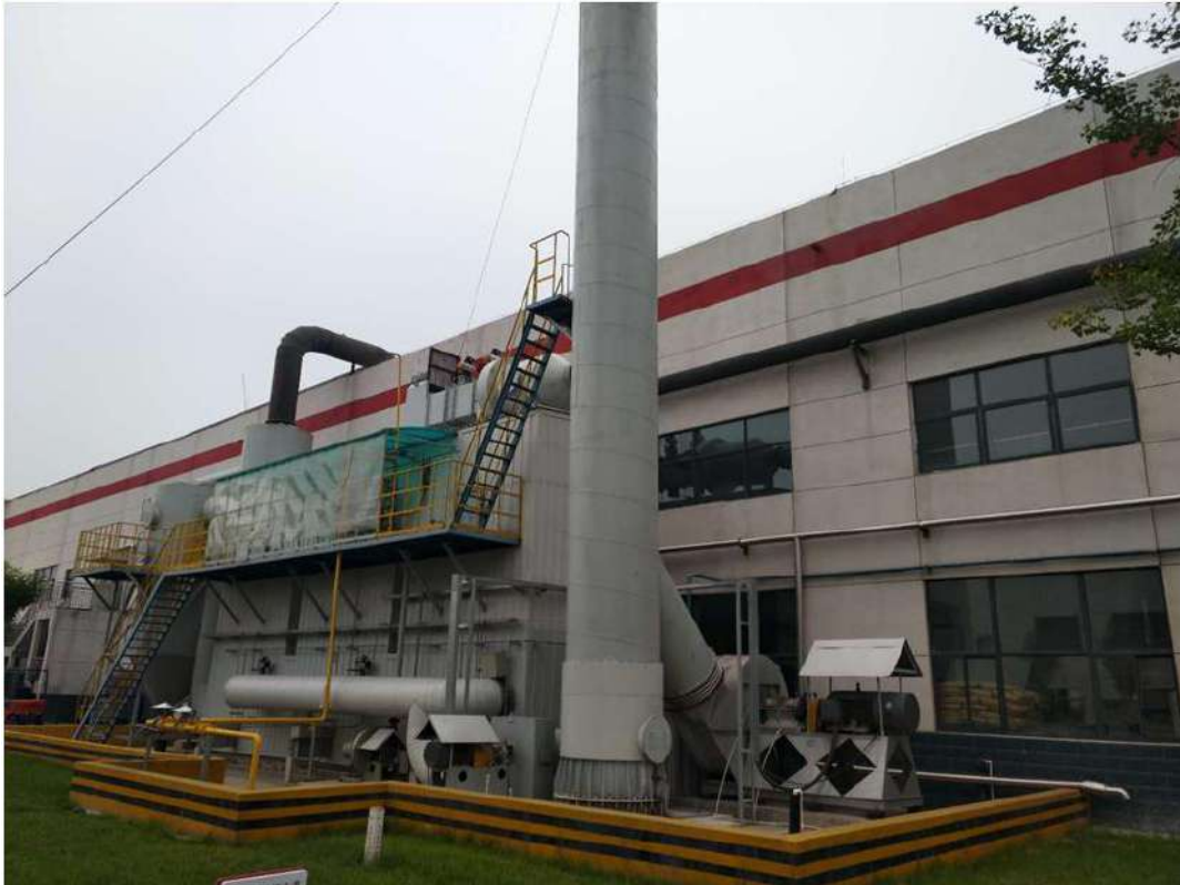
图 2 RTO 烟气处理环保装置

东方雨虹不仅在生产中践行 节能减排 之理念，在 日常的办公及生活中 ，公司亦是 绿色行动的倡导者和实践者 。公司积极推行 无纸化办公、完善车辆管理制度、合理用水 等措施，实现了日常办公的绿色形象。